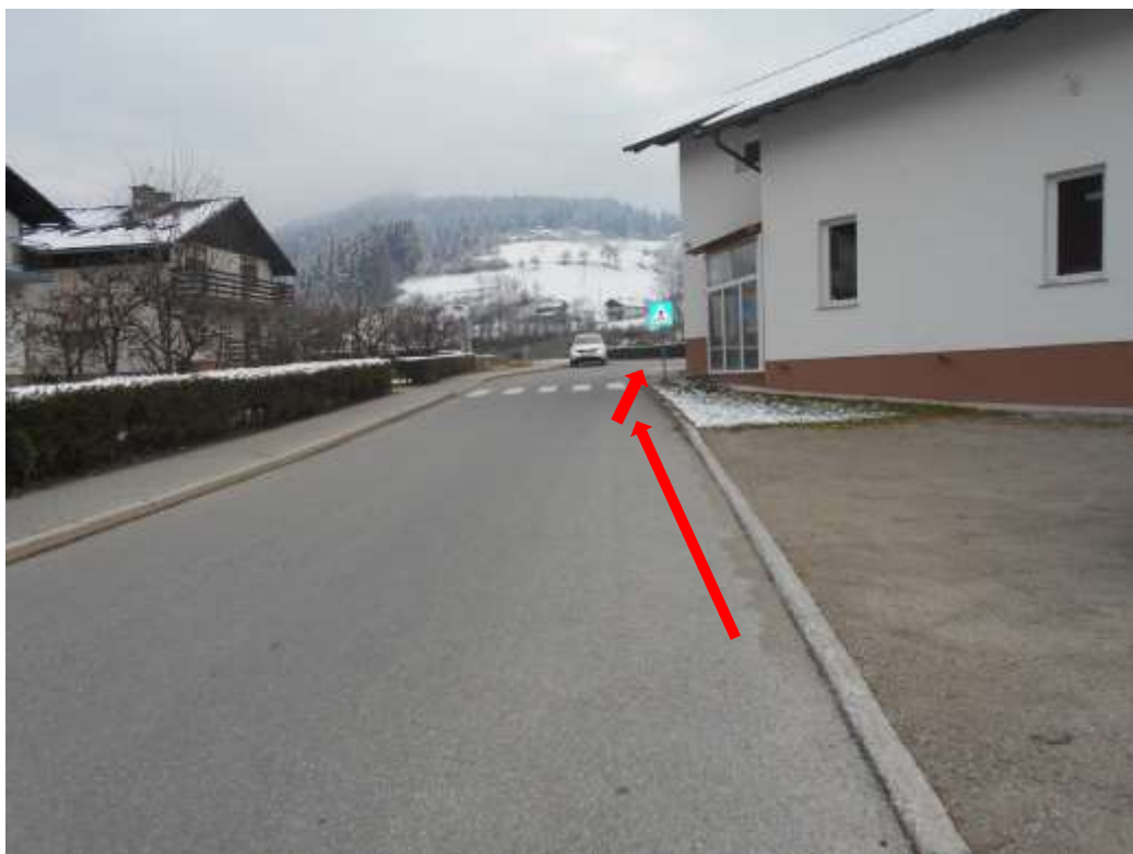
Križišče Šolske in Gozdarske ceste